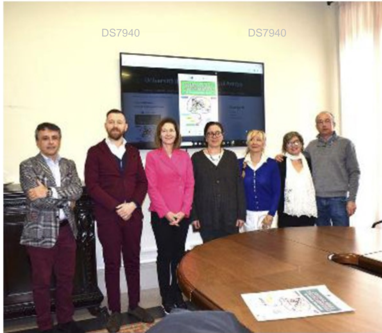
La presentazione del primo festival della salute mentale ad Arezzo